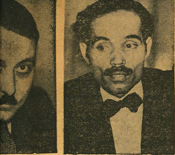
Luis Muñoz Marín (izquierda) recibió ayer a los sus oficinas de San Juan y dijo que se había dado arresto del líder nacionalista Pedro Albizu Campos enciando en 1936 a Atlanta por conspirar para gobierno de los Estados Unidos en Puerto Rico.