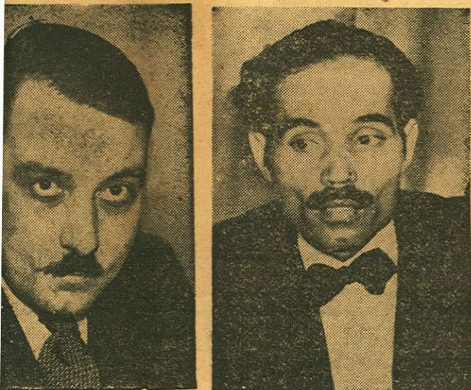
ernador Luis Muñoz Marín (izquierda) recibió ayer a los tas en sus oficinas de San Juan y dijo que se había dado para el arresto del líder nacionalista Pedro Albizu Campos a), sentenciado en 1936 a Atlanta por conspirar para r al Gobierno de los Estados Unidos en Puerto Rico.