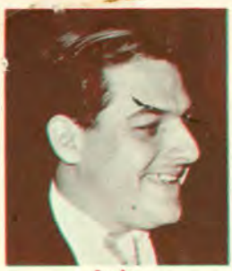
Ledo. Rafael Hernández Colón