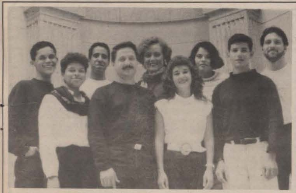
La agrupación venezolana Ensamble 9