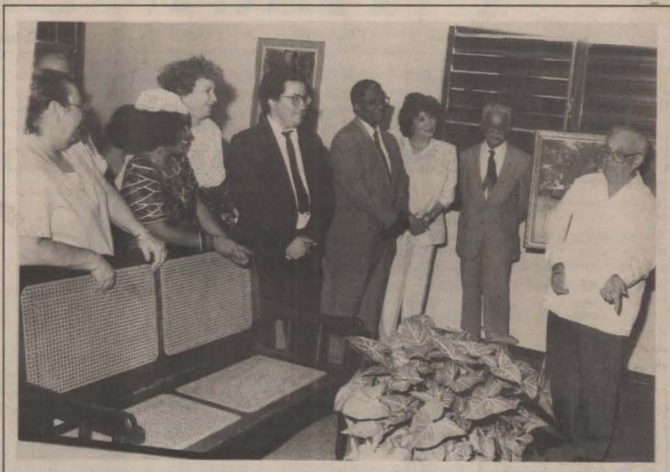
Francisco Matos Paoli, a la extrema derecha, se dirigió a la familia Palés y a los invitados especiales durante la inauguración de la Sala Palesiana en el Colegio Regional de Guayama de la Universidad Interamericana.