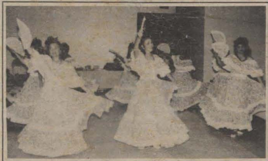
El Grupo de Danzas de Cayey ejecutó el "Mensaje del abanico" en el anfiteatro de Guayama.