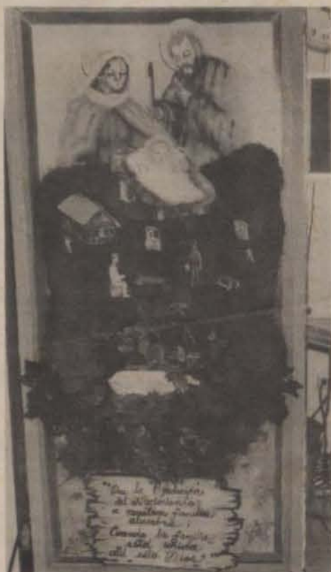
Detalle de una de las puertas de las oficinas de la Administración Central, adornada para la Navidad.

Nadie lo podía entender, pero a medida que caía el polvo todos se sentían felices; el odio desapareció, las guerras terminaron, los enemigos ahora eran amigos. Entonces un niño gritó: "Mami, mami Santa Claus nos regaló AMOR." Desde ese momento nadie volvió a pasar un día en que no rieran la paz y la felicidad.