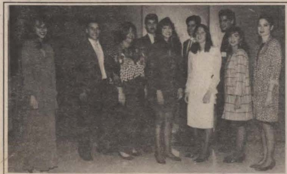
La nueva directiva de la Asociación de Estudiantes de Contabilidad