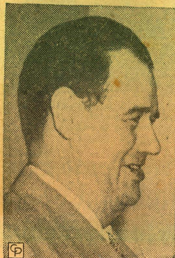
SENADOR JOHNSTON Anunció que aceptaba la resolución, a pesar de que eliminaba su enmienda y anunció que explicará su actitud en el Diario de Sesiones.