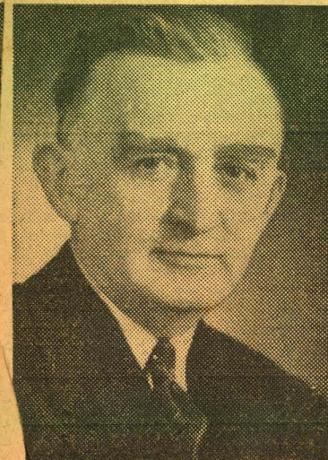
SENADOR O'MAHONEY Propuso la consideración de la resolución de avenencia a las 4:14 P. M. Tan pronto el Senado ratificó el Pacto de Paz con Alemania.