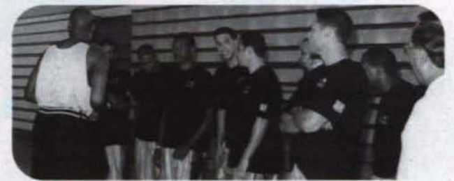
(La autora es Decana de Administración del Recinto de Fajardo)

Con esta actividad el Recinto de Fajardo de la Universidad Interamericana de Puerto Rico, valida su compromiso de servir bien a la comunidad del noreste de Puerto Rico.