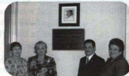
El auditorio del Centro de Estudiantes en San Germán, lleva el nombre Don Fundador Santiago.