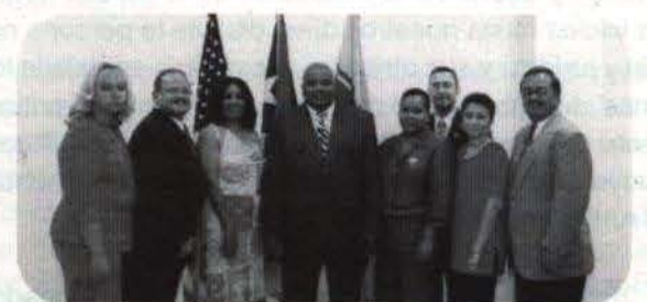
El rector del Recinto de Fajardo, a la extrema derecha, comparte con un grupo de profesores del sistema público del área este que participaron en el adiestramiento.

A los maestros se les capacitó en la preparación de cursos interactivos presentados en formato de archivo en la red. A su vez, se ofreció adiestramiento para establecer enlaces con otros cursos, lograr la integración de gráficas, animaciones, archivo, sonido y video. "Esperamos que pronto los estudiantes puedan beneficiarse de estos cursos. Con esto podemos proveerle una estrategia de aprendizaje que podría ayudar a