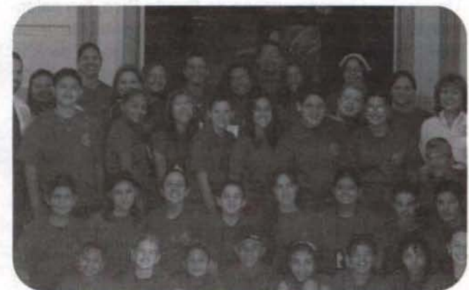
Participantes de la Academia de verano HCOP en San Germán.

(La autora es Coordinadora Escolar del Recinto de San Germán)