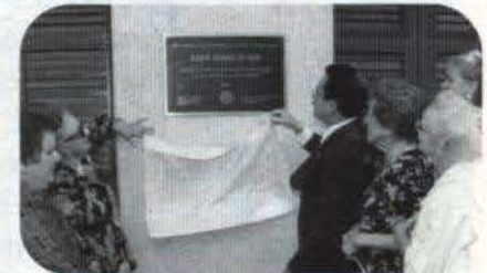
Tarja en honor a Don Aurelio Tió.