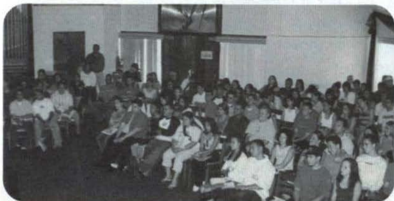
Campamento de Verano Siglo XXI: Fuente de Retos

(La autora es directora del Programa de Educación Continuada del Recinto de San Germán)