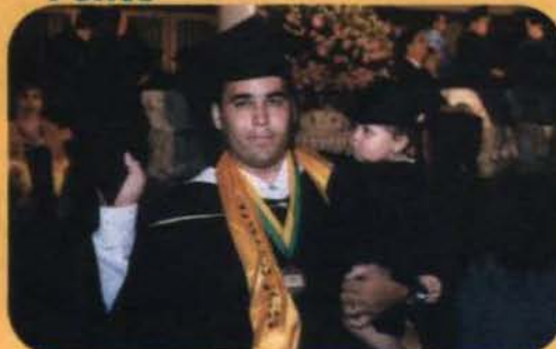
Graduando del recinto ponceño recibe la admiración de su pequeña hija.