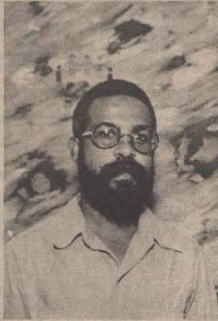
Genaro Phillips Pintor Dominicano

Genaro Phillips pertenece al post-expresionismo dominicano, que integra abstracción y figuración.