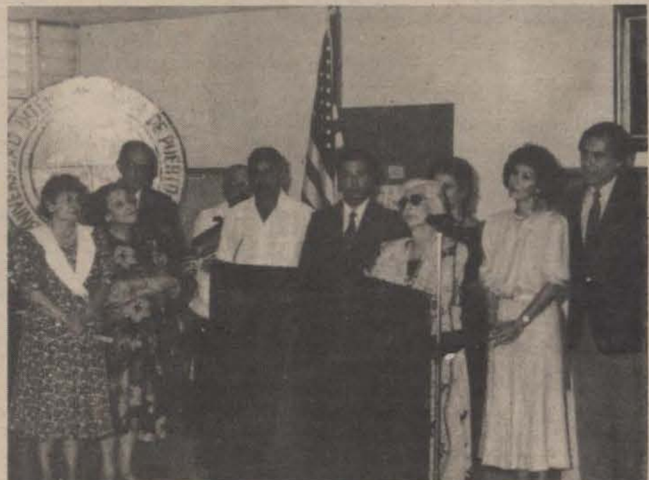
Los familiares de don Emilio Belaval agradecieron el acto en honor a este ilustre puertorriqueño.

La figura de Emilio S. Belaval precedida por su tarja en el Centro de Recursos Educativos del Colegio Regional de Fajardo, servirá de inspiración a aquellos que dediquen su afición al estudio de nuestra literatura.