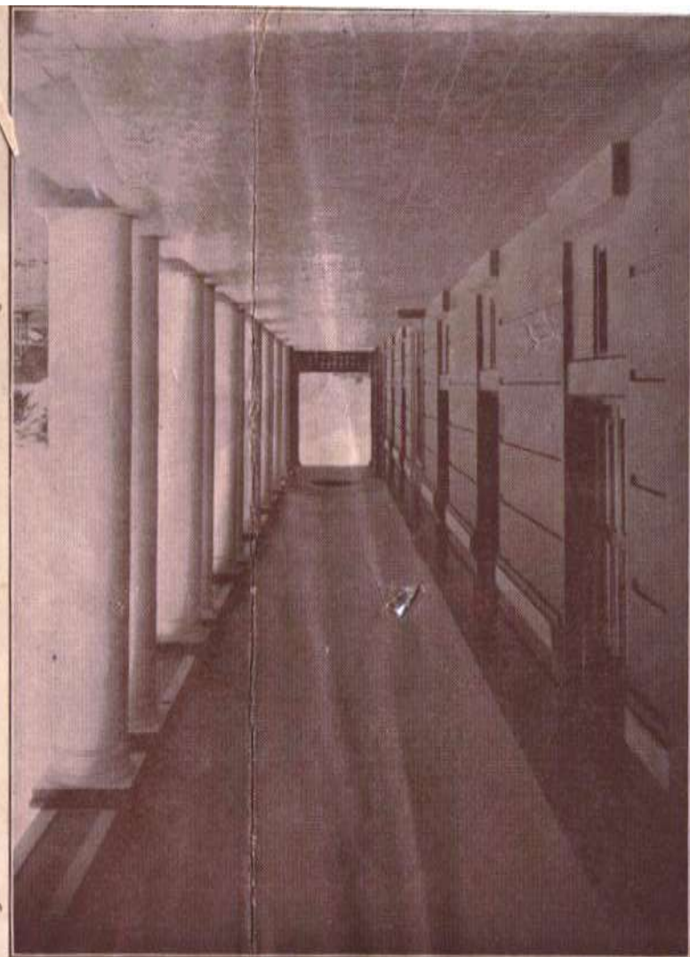
Espacioso corredor del edificio principal del Instituto Politécnico, desde el que puede apreciarse en todos sus detalles esplendorosos un soberbio paisaje de las colinas suaves que rodean como un cinto a la histórica ciudad de "Las Lomas", asiento de esta la futura Universidad Pan Americana.