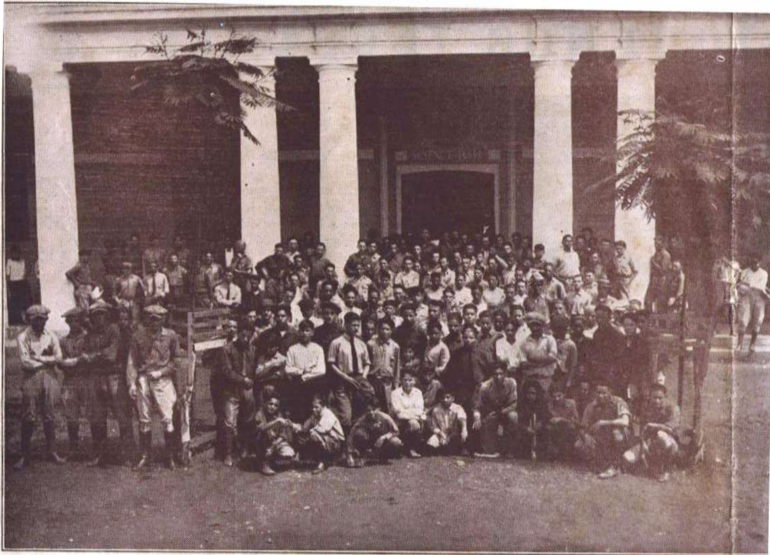
Aspecto que ofrecía el Edificio de Ciencias del Instituto Politécnico de San Germán, en los momentos de terminar sus clases es nutrido grupo de varones que cursan diversos estudios preparatorios y científicos.