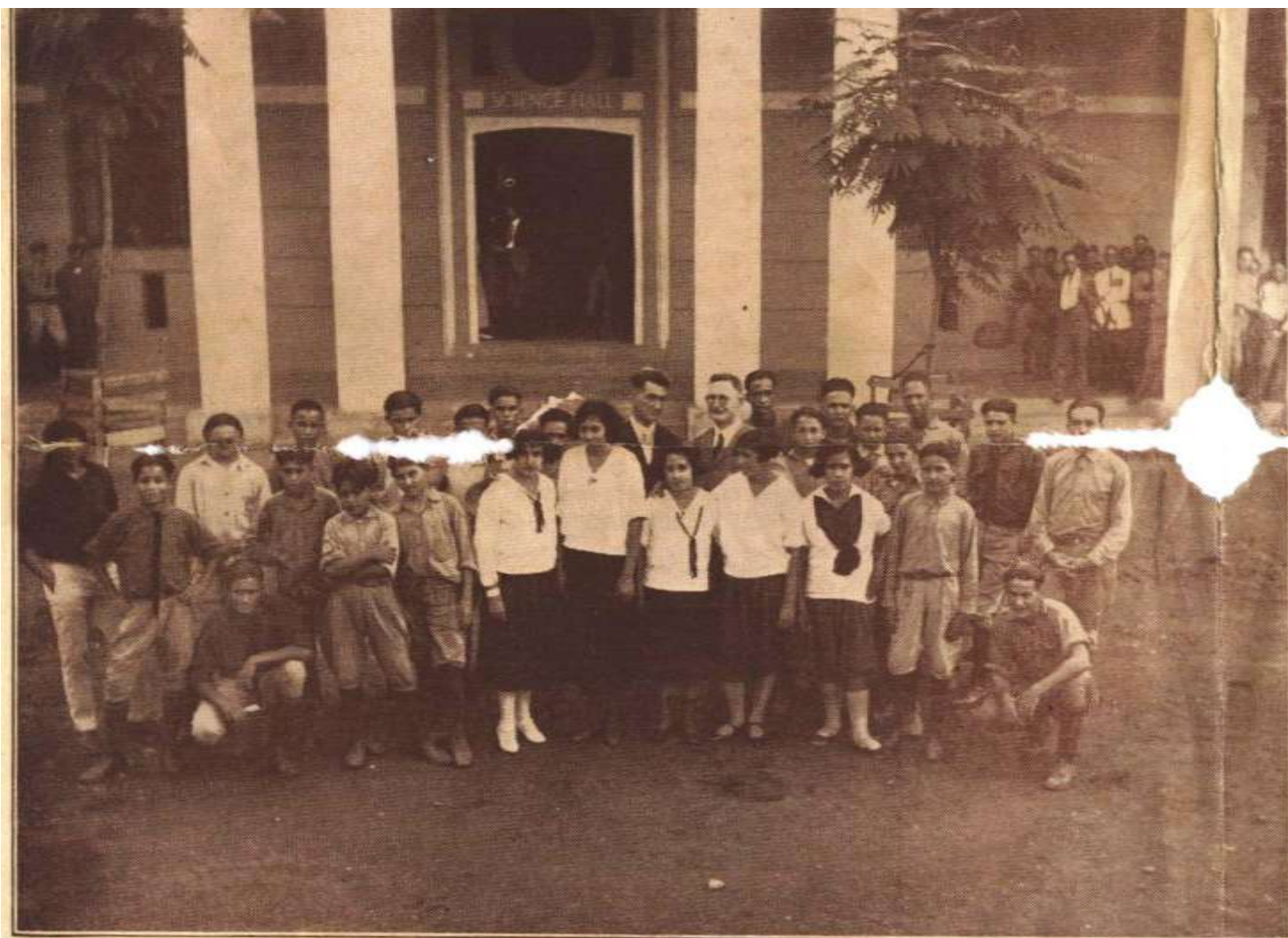
Grupo formado por los alumnos de ambos sexos procedentes de San Juan que se reunieron frente al edificio principal para tomar parte en la ca'urosa recepción que dispuso el Instituto Politécnico a los periodistas de San Juan, compueblanos de estos simpáticos estudiantes a quienes la dulce soledad de su retiro no cura la nostalgia de su "Ciudad Encantada"