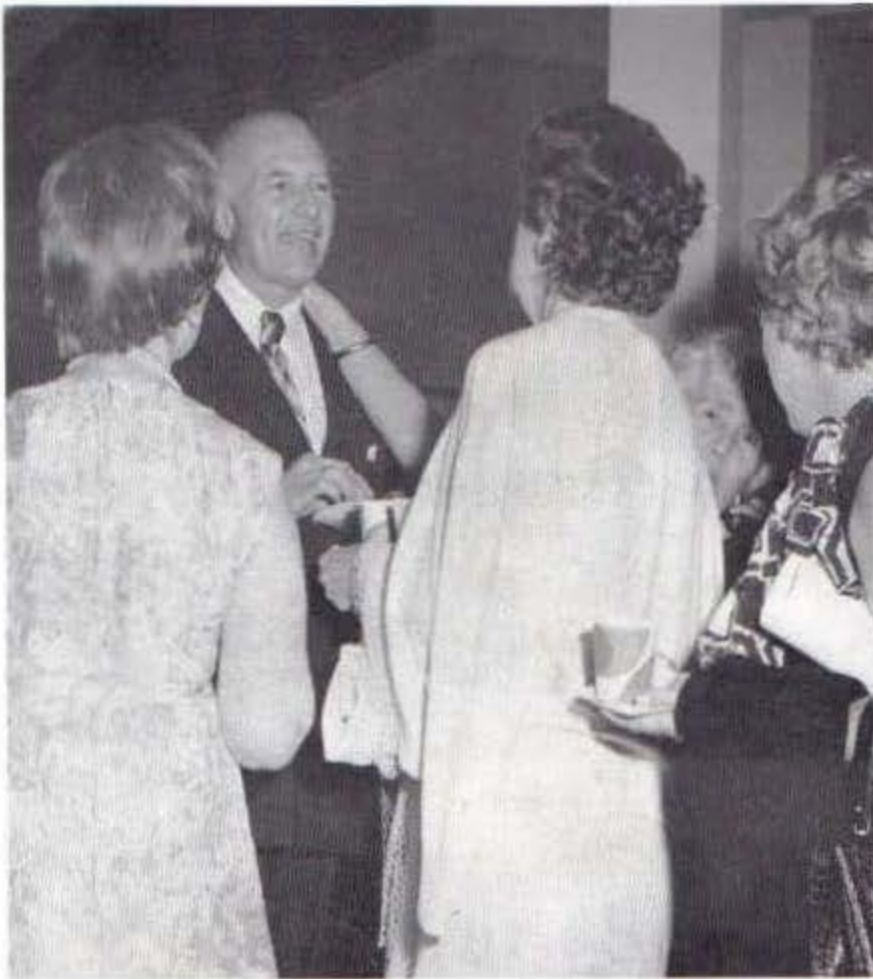
ARRIBA, el Presidente Descartes es felicitado por dos admiradoras durante la recepción que sucedió a la inauguración.