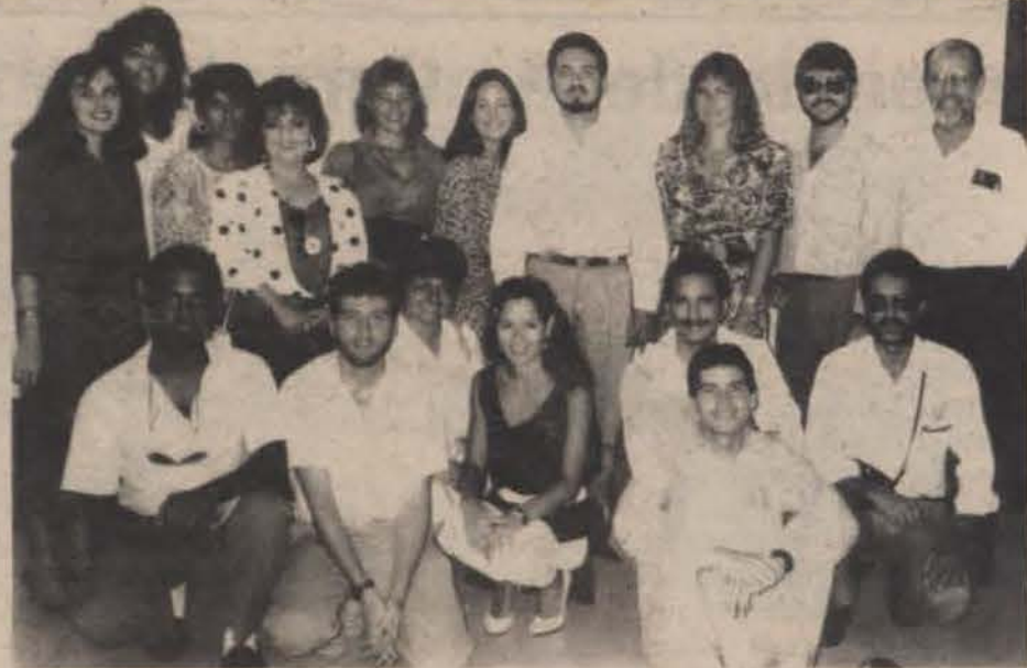
La Asociación de Servicios Voluntarios Optométricos comenzó a trabajar desde agosto del 1986 y presta servicios gratuitos. Integran la misma estudiantes y profesores de la Escuela de Optometría de la UIPR.

En Puerto Rico hemos visitado Country Club, Culebra y Toa Baja. Nuestra organización se ha mantenido con donaciones privadas y ayuda de la Universidad. En lo futuro trataremos de seguir dando servicios visuales gratuitos a personas necesitadas en el extranjero y en Puerto Rico.