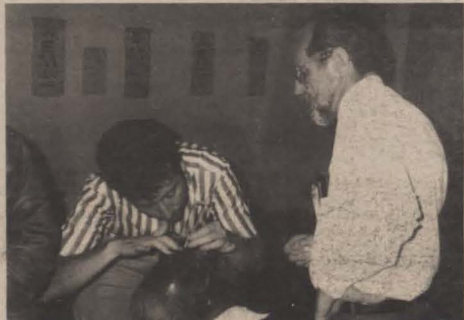
La Asociación ha llevado clínicas a varios lugares de Puerto Rico y del exterior.