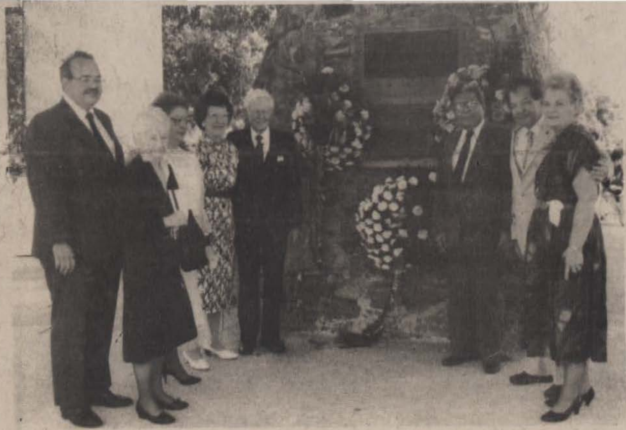
Es tradición recordar la memoria de los fundadores al pie de las viejas escalinatas en el Recinto de San Germán.