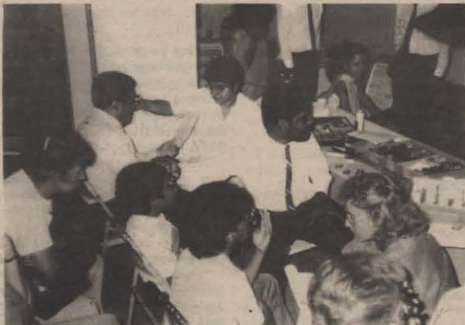
En sus clínicas ya han atendido a más de 500 personas.