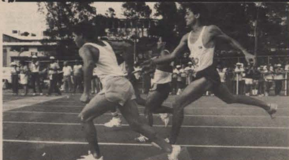
Los Poly Relays resultaron un éxito.