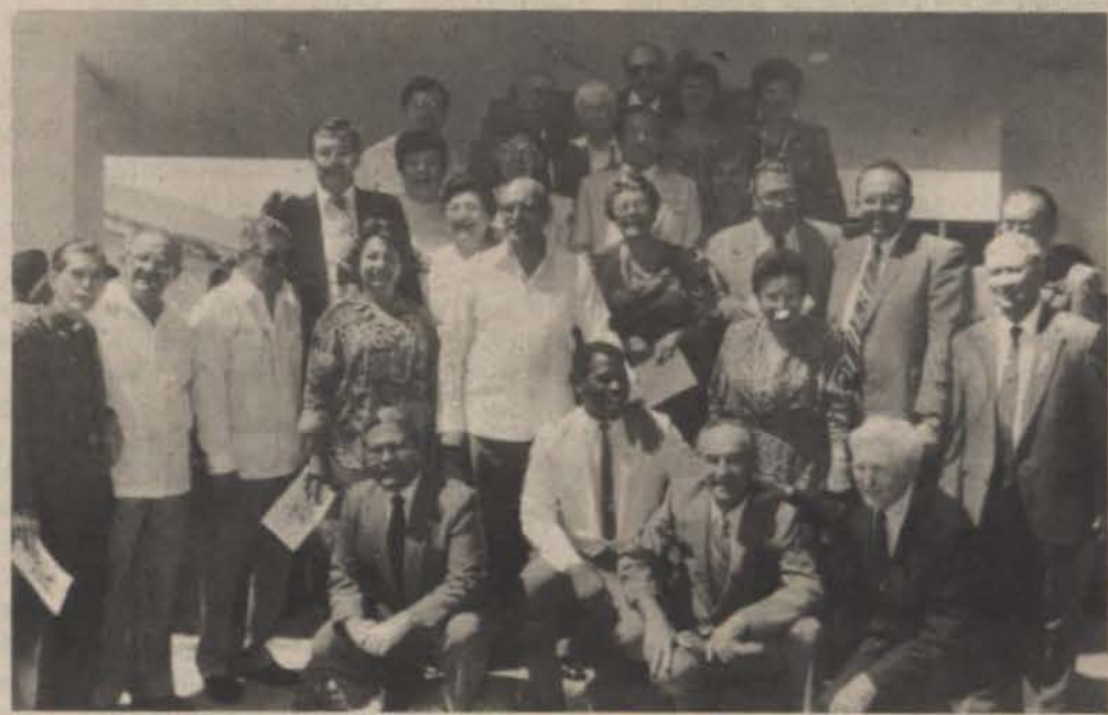
Un grupo de ex-alumnos y amigos disfrutaron de las celebraciones de "Founders" en las Escaleras Históricas.