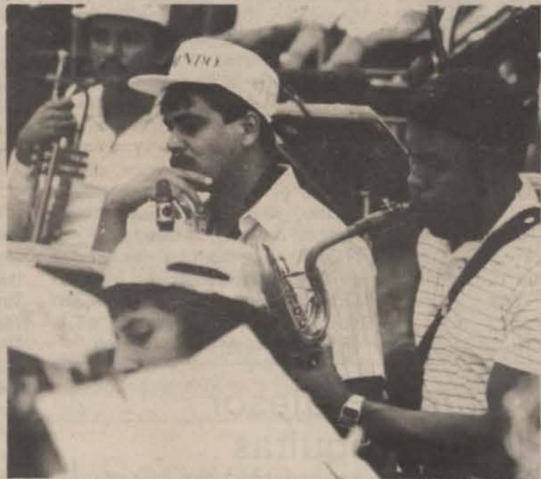
Cientos de Estudiantes participaron en el Tercer Festival Nacional de Bandas.