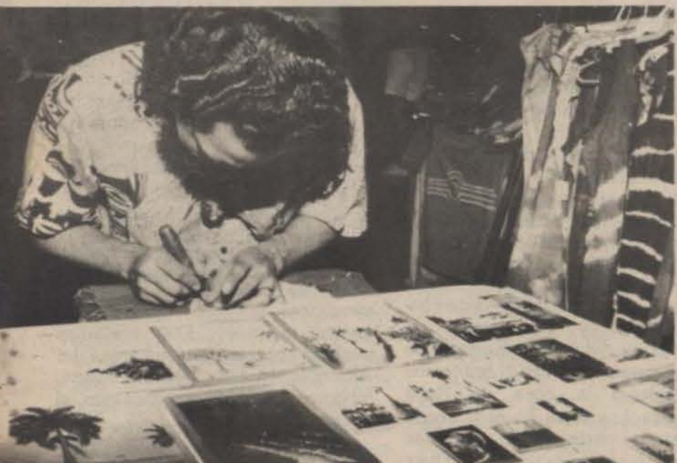
La expresión artesanal puertorriqueña se dio cita en San Germán durante la Feria de Artesanía.